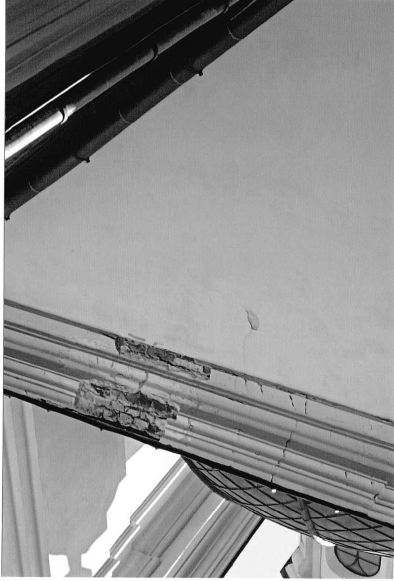
Fot. 7 Kościół parafialny p.w. św. Marii Magdaleny w Dukli, II pol. XVIII w. Górna część jednej z kaplic. Widoczny duży ubytek gzymsu. Farba na gzymsie jest popękana, odspaja się i łuszczy. Sierpień 2024 r.