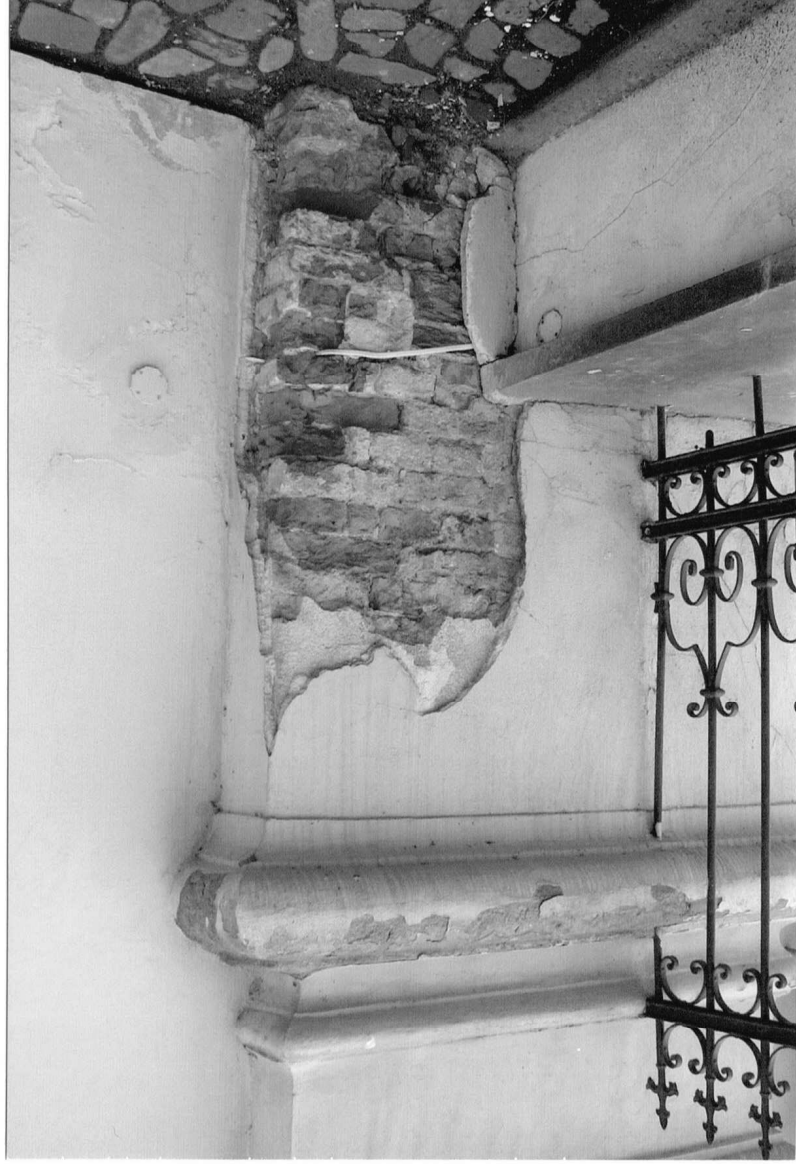
Fot.3 Kościół parafialny p.w. św. Marii Magdaleny w Dukli, II pol. XVIII w. Dolna część pilastra północnej elewacji dzwonnicy. Widoczny duży ubytek tynku i cegieł. Na półwałku powyżej, ubytki farby z widocznymi nawarstwieniami mchu. Grudzień 2023 r.