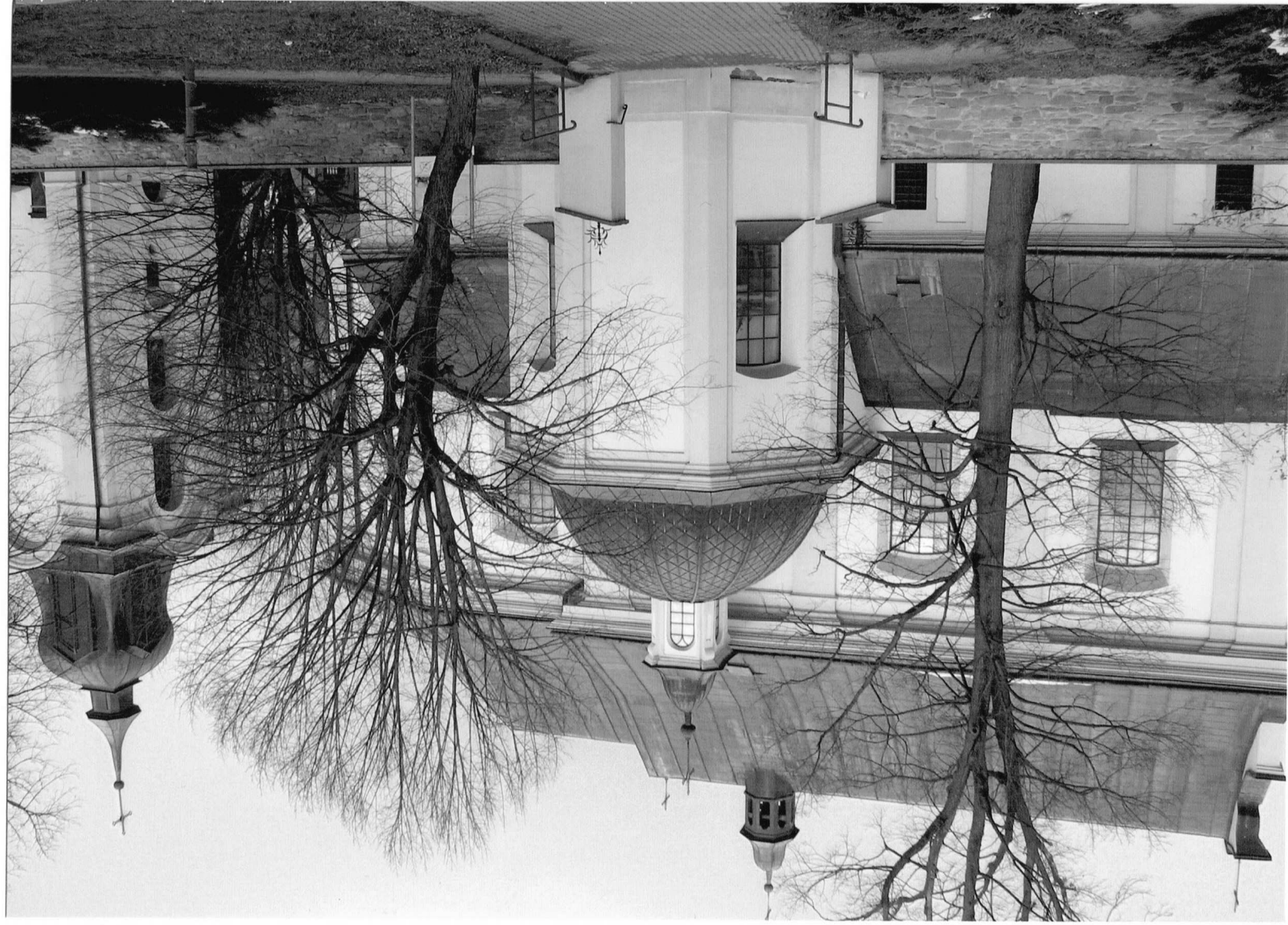
Fot.1 Kościół parafialny p.w. św. Marii Magdaleny w Dukli, II poł. XVIII w. Widok na kościół i dzwonnice od strony południowej. Grudzień 2023 r.