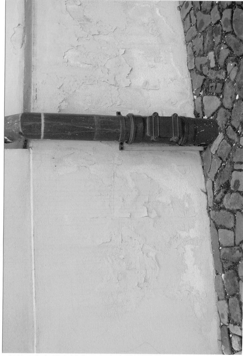
Fot.5 Kościół parafialny p.w. św. Marii Magdaleny w Dukli, II poł. XVIII w. Dolna część południowej elewacji kościoła. Widoczne liczne przetarcia, złuszczenia i ubytki farby. Grudzień 2023 r.