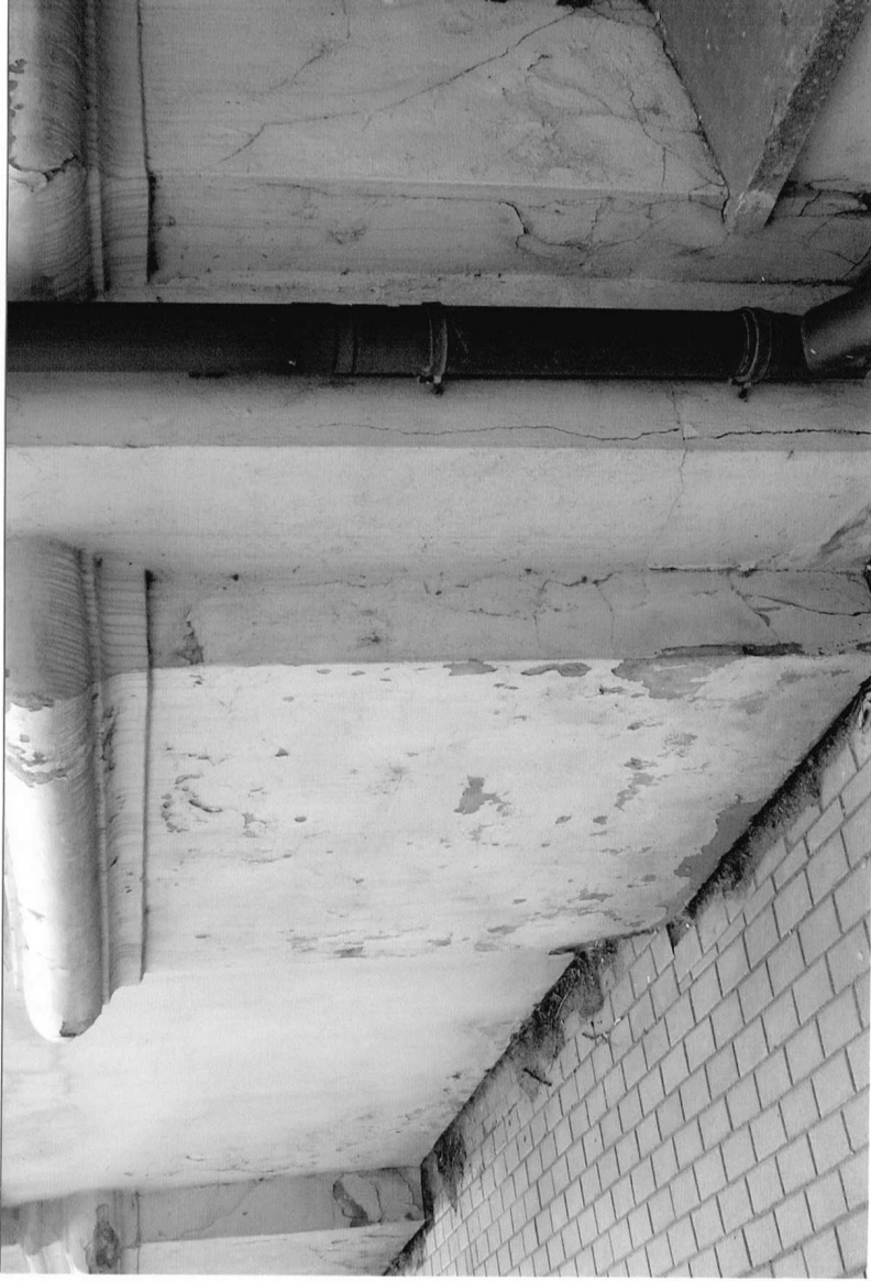
Fot.4 Kościół parafialny p.w. św. Marii Magdaleny w Dukli, II pol. XVIII w. Dolna część pilastrow w narożu północno-wschodnim elewacji dzwonnicy. Widoczne pęknięcia tynku oraz liczne przetarcia i ubytki farby. Grudzień 2023 r.