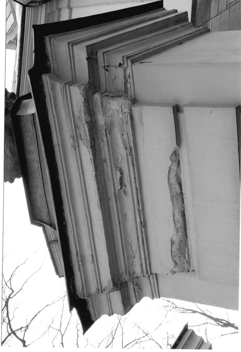
Fot.6 Kościół parafialny p.w. św. Marii Magdaleny w Dukli, II poł. XVIII w. Zwieńczenie jednego ze słupów ogrodzenia. Widoczny ubytek tynku na boniowaniu, a na gzymsie przetarcia, złuszczenia i ubytki farby. Grudzień 2023 r.