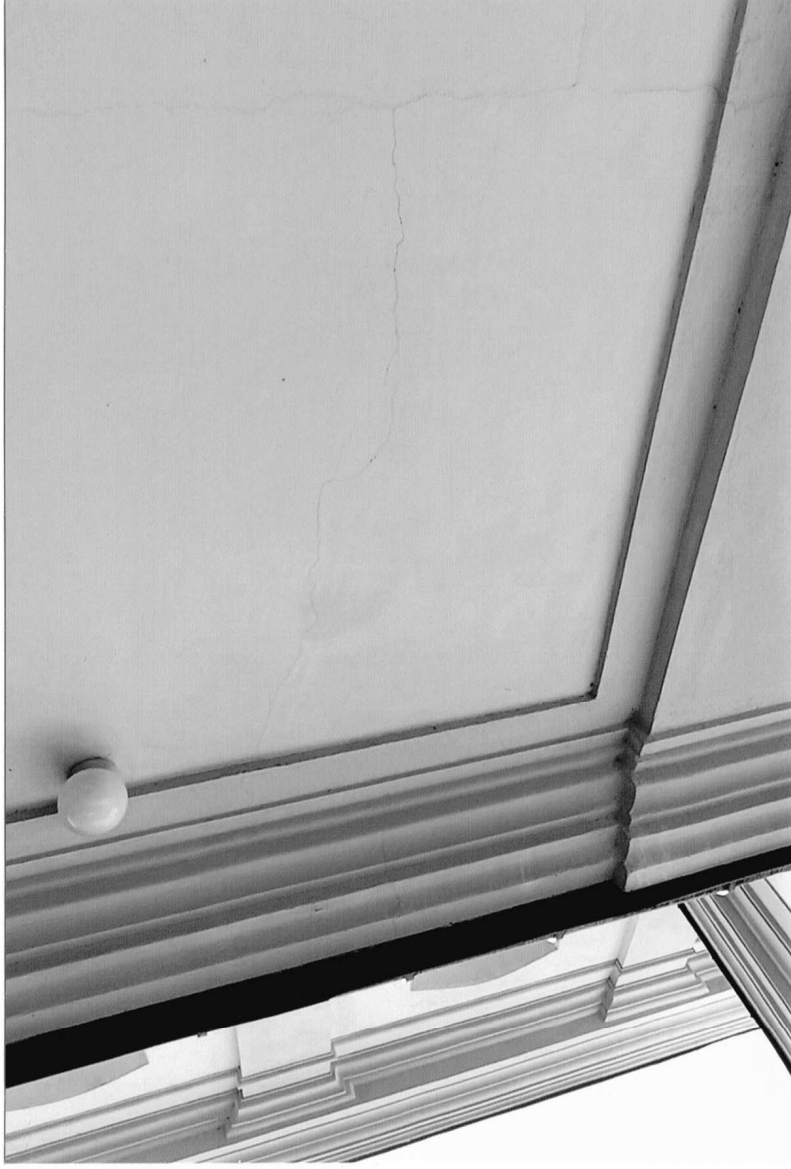
Fot. 8 Kościół parafialny p.w. św. Marii Magdaleny w Dukli, II pol. XVIII w. Gzyms wieńczący i fragment ściany jednej z kaplic. Widoczne pęknięcia w obrębie tynku i gzymsu. Sierpień 2024 r.