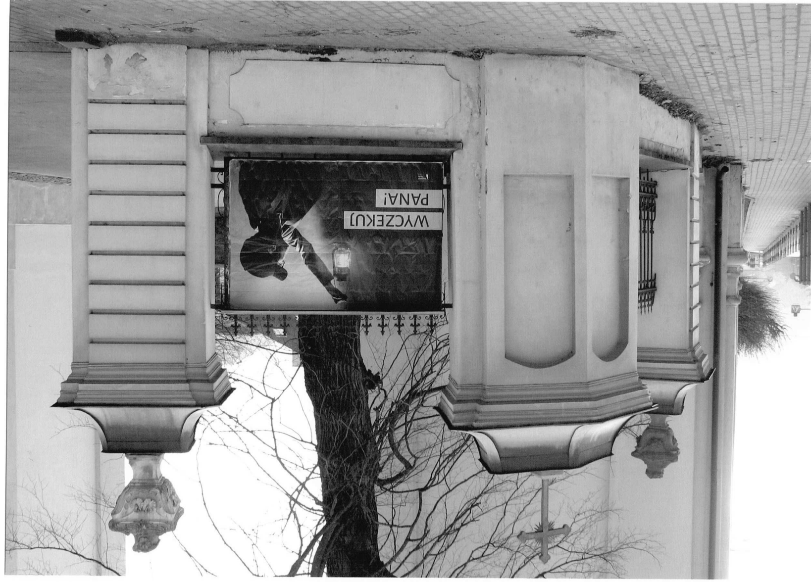
Fot.2 Kościół parafialny p.w. św. Marii Magdaleny w Dukli, II poł. XVIII w. Widok na część ogrodzenia placu kościelnego od strony północnej. Grudzień 2023 r.